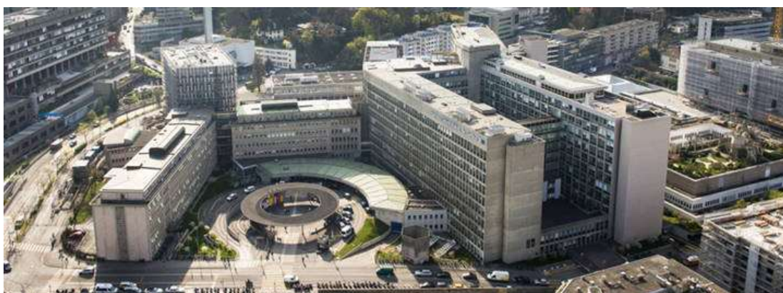
Hôpitaux Universitaires Genève HUG

La rencontre du groupe régional ouest (romand et tessinois), aux HUG, a été un véritable échange de connaissances. De nombreuses questions ont été inscrites à l'ordre du jour. Les réponses ont été consignées dans un procès-verbal sous la question correspondante. C'est un bon exemple de la manière dont les réponses à des thèmes déjà traités, peuvent être relues lors de questions futures. Le réseautage a eu lieu au début de la rencontre, pendant la pause et le repas de midi. Cette rencontre régionale a été un grand succès. Un grand merci aux organisateurs.