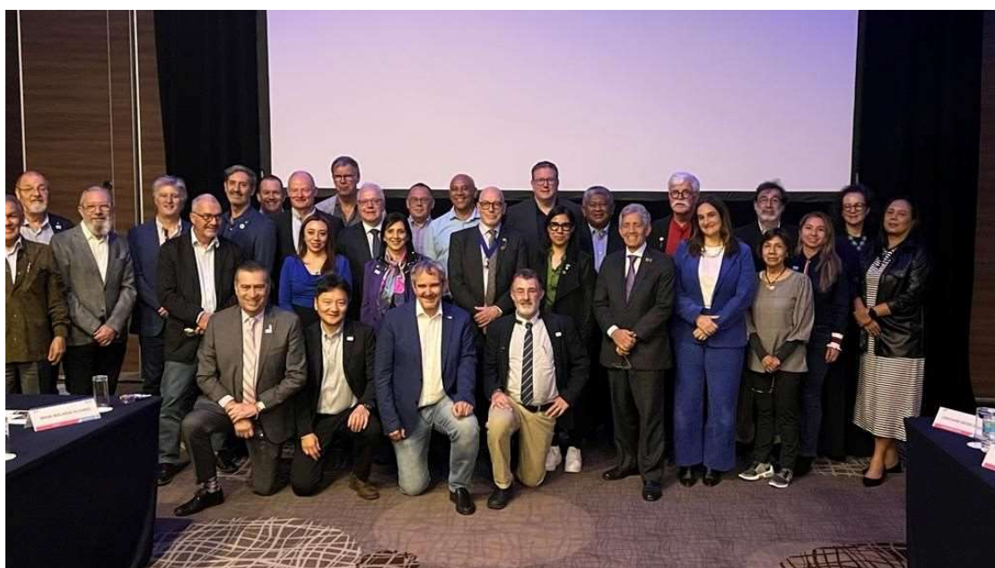
Réunion des membres du Conseil de l'IFHE lors du congrès international du 6 novembre

IFHE, 19ème congrès international du 6 au 8 novembre 2023 à Mexico City