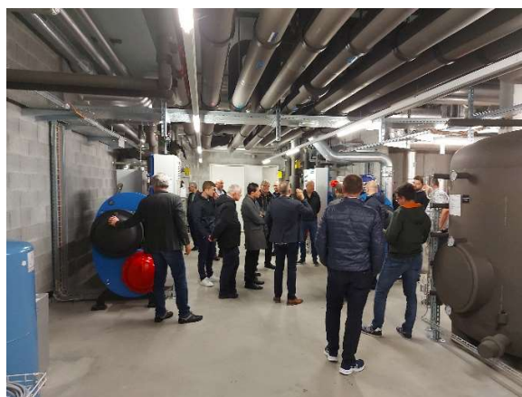
Sur le tour de table