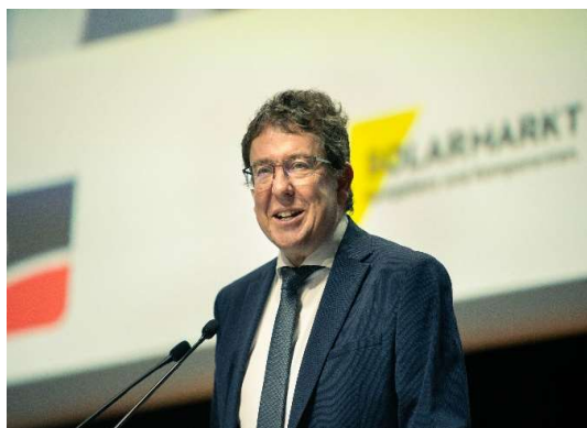
Allocutions : Conseiller fédéral Albert Rösti

La 22e édition du Congrès suisse du photovoltaïque s'est tenue les 21 et 22 mars à l'EPFL à Lausanne, avec une allocution d'ouverture du conseiller fédéral Albert Rösti. Plus de 10 pour cent des besoins annuels en électricité de la Suisse proviennent déjà d'installations solaires et contribuent déjà largement à la sécurité de l'approvisionnement - même en hiver. Mais il faut aller plus loin. La question centrale de la conférence est de savoir comment atteindre une production d'électricité solaire cinq fois plus élevée au cours des dix prochaines années. Le secteur est prêt, la loi sur l'électricité crée les conditions politiques nécessaires.